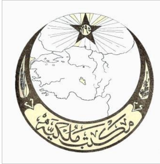
Kaynak: Çankaya, Cilt: I, s.475.