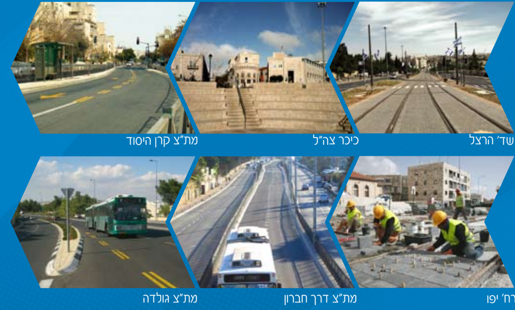
שד" הרצל, כיכר צה"ל, מת"צ קרן היסוד